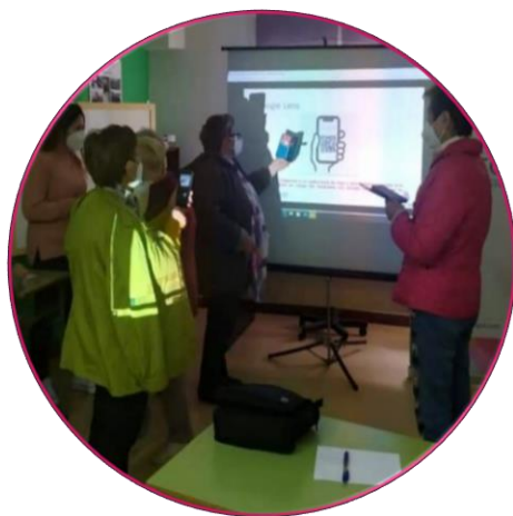
Socialización en el aprendizaje

Necesidad de compartir Aprendizaje entre iguales Sinergias entre participantes