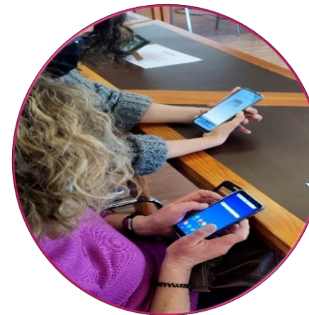
Compartir los miedos y dudas

Necesidad de compartir Aprendizaje entre iguales Sinergias entre participantes